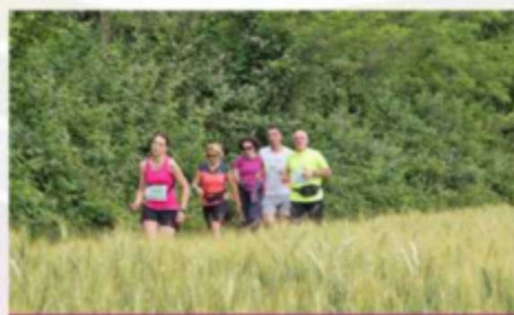
La manifestazione si svolgerà anche in caso di pioggia

CORRIAMO per LA SALVAGUARDA dell'AMBIENTE